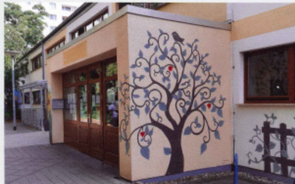
Seminarort: Johannes-R.-Becher-Str. 57, 39128 Magdeburg